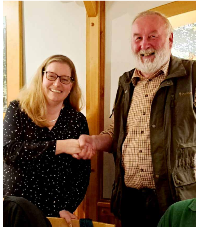
Euer Hilmersdorfer Heimatverein e. V.